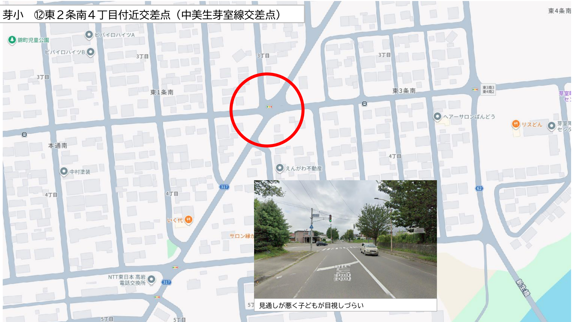
見通しが悪く子どもが目視しづらい