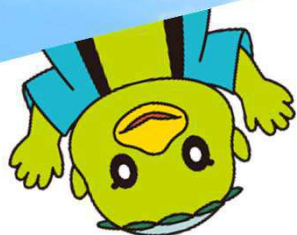
揖斐川町マスコットキャラクター かっぱの河太郎