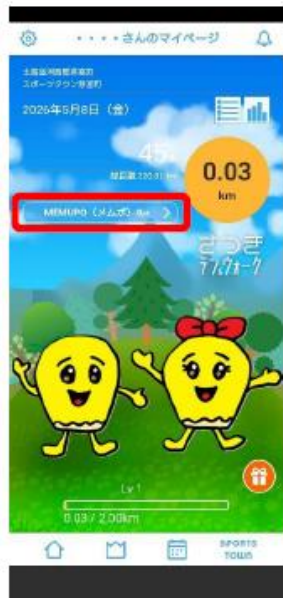
① トップ画面から『MEMUPO(メムポ)』をタップ