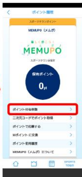
② 『ポイント付与申請』をタップ