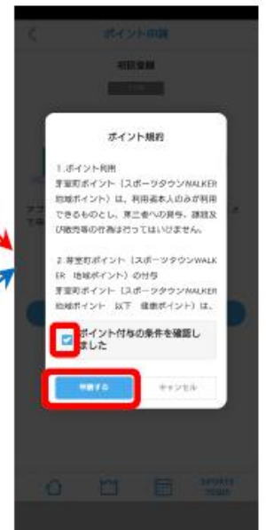
⑤ 『ポイント付与の条件を確認しました』にチェックを入れ、『申請』をタップ