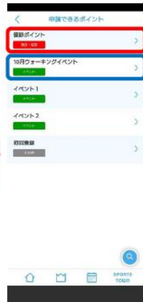
③ 申請できるポイントから項目を選択しタップ