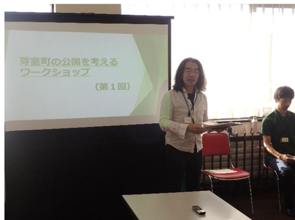
ワークショップ主旨説明