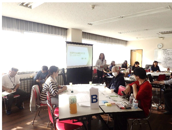
ワークショップ開始