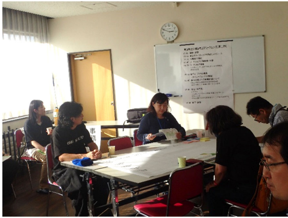
ディスカッション（A班）