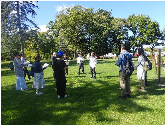
芽室公園緑地広場(見学スタート前)