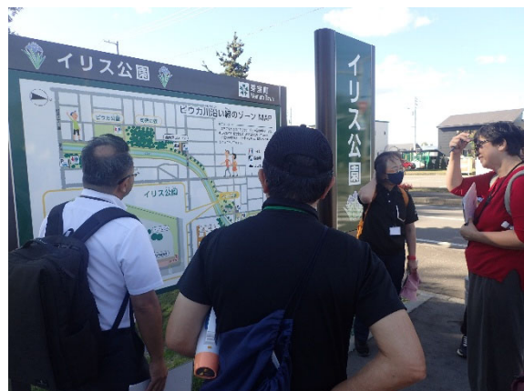
公園見学（イリス公園）