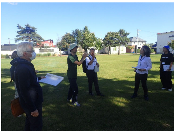
公園見学（緑町児童公園）