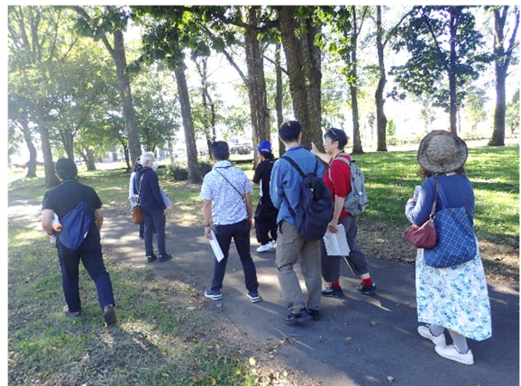
公園見学(芽室公園花菖蒲園内)