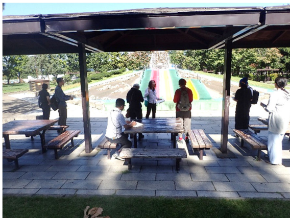
公園見学(芽室公園四阿からの噴水滑り台)