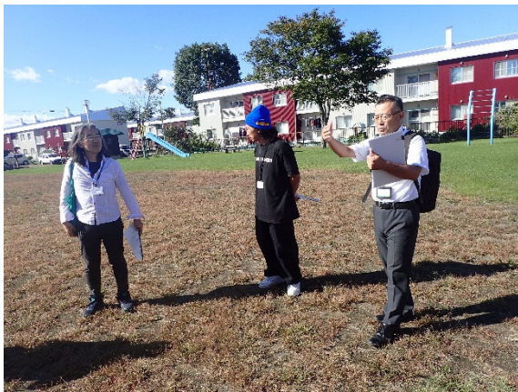
公園見学（西町児童公園）