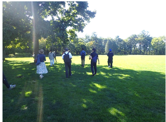
公園見学(芽室公園緑地広場)