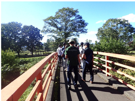
公園見学(芽室公園花菖蒲園に向かう木橋)