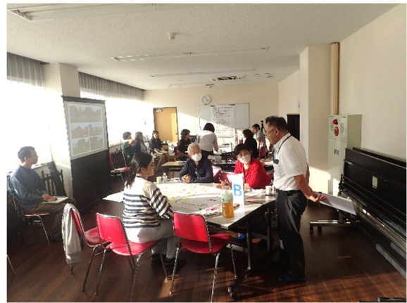
ディスカッション（B班）