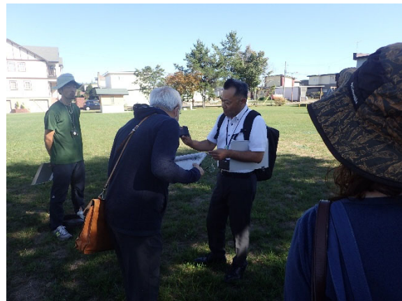
公園見学（緑栄児童公園）