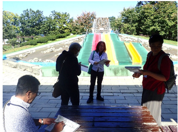
公園見学(芽室公園噴水滑り台)