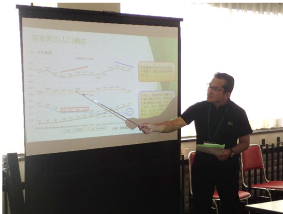
ストック再編計画説明