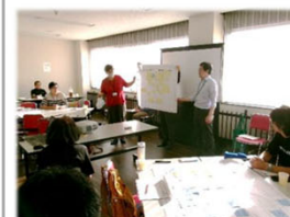
参加者全員に意見を伝えます。