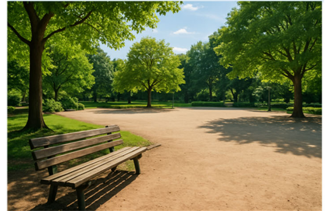
休養型（憩いの広場）