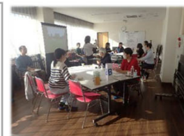
グループごとに意見を出し合いました。