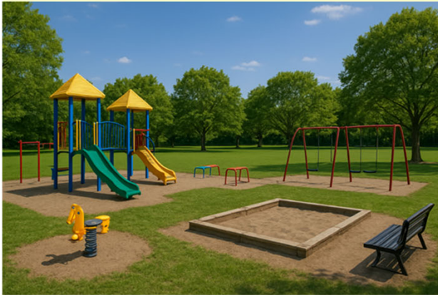
子ども型（児童公園）