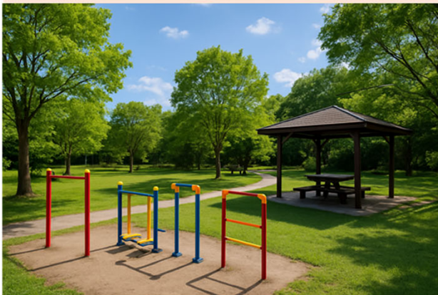
高齢者型（憩いと運動の広場）