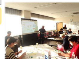
芽室町の公園に関する説明を聞きました。