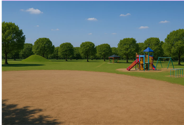
交流型（地域の核となる公園）