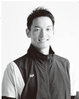
▲佐藤久佳さん 2008年北京オリンピック 4×100m メドレーリ レー銅メダリスト