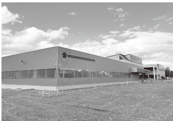
▲約1年の工事を経て、新しくなった温水プール

今月号ではオープニングイベント や営業時間、利用料金をご紹介します。 この機会に、新しくなったプ ールで泳いでみませんか？