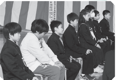
かみ び せいしょうがっこう 上美生小学校