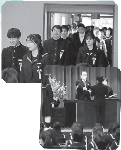
め むろちゅうがっこう 芽室中学校