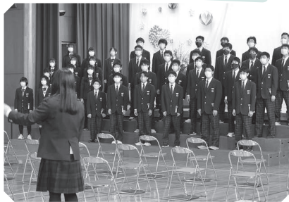
め むろにしちゅうがっこう 芽室西中学校