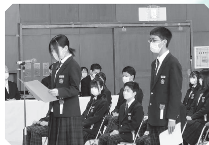
かみ び せいちゅうがっこう 上美生中学校