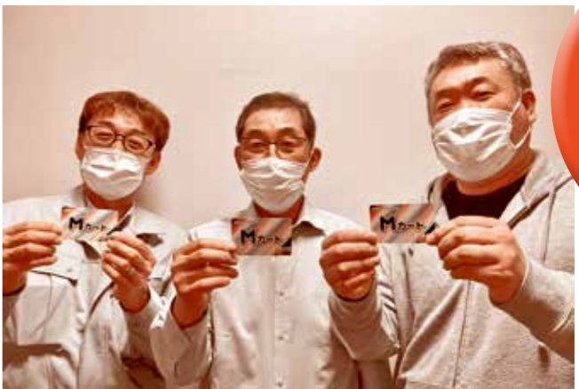
町内での買い物は「Mカード」を合言葉に!