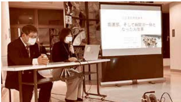
出水総合医療センター(鹿児島県)花田院長(写真左)と妙園看護副部長(写真右)