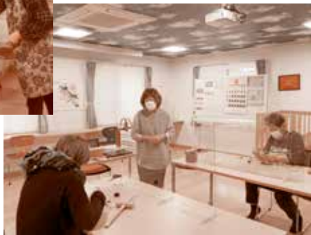
教えて先生革細工の様子▶