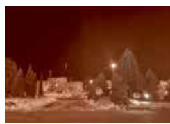
駅前ロータリーのイルミネーション