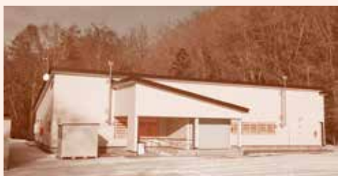
▶ 広尾町役場企画課企画防災係 ☎01558-2-0184

今後も、ひとりひとりの心構えや行動が「もしもの時に命を守る」ことに繋がるということを忘れず、いつ起きるかわからない災害に備えるよう、町民のみなさまと取り組んでいきます。