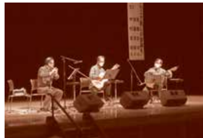
Grazie '95による講演の様子