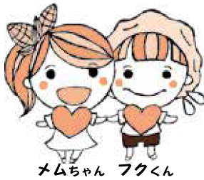
メムちゃん フクくん

芽室町社会福祉協議会は、地域福祉事業と介護保険事業が一体となり、「支えたり」「支えられたりする」地域共生型のめむろの実現を目指します。