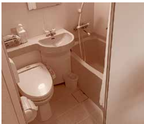
特別室の様子 (写真上：病室内 / 写真下：トイレ・浴室)

これからも院内外を問わず、様々な職種と連携し、退院する患者さまが希望される場所で安心して生活することができない、後押しできるように日々研さんを続けていきたいと思っております。