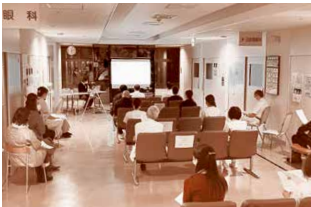
93人の職員が熱心に聴講

未来を担う若者の仕事の選択肢の一つの参考となり、多くの医療従事者が生まれることを願います。