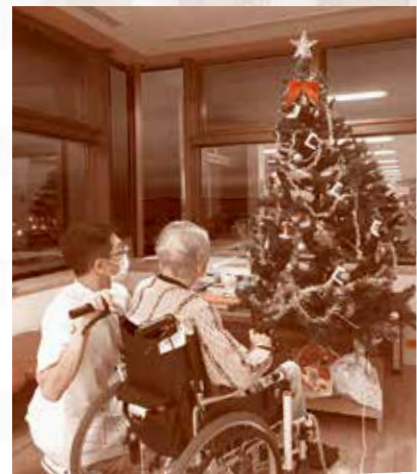
院内に設置したツリー

患者さまからは「季節を感じる」「気持ちが前向きになる」との話をはじめ、笑顔でご家族とのクリスマスの思い出などを語ってくれる方もいました。今後も患者さまに喜んでいただける企画を考えていきます。