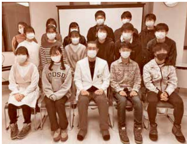
研谷院長と記念撮影