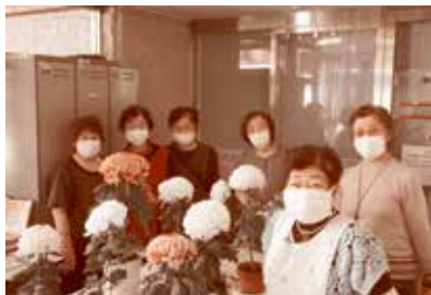
園芸クラブの活動の様子