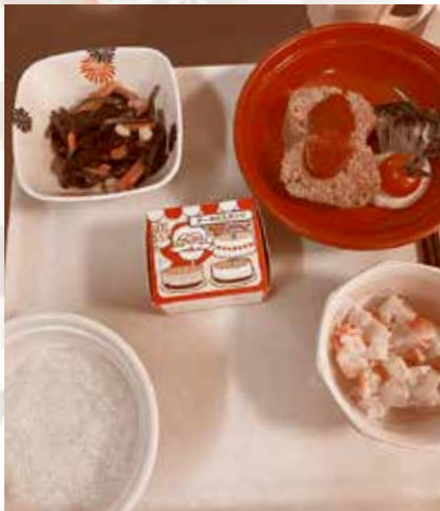
入院用クリスマス特別メニュー

病棟別に、23日・24日の入院患者さんの昼食にクリスマス特別メニューを提供し、いろいろと制限のある入院生活の中ではありますが、クリスマス気分を味わい、少しでも明るい気持ちになっていただきたいとの思いから開催しました。