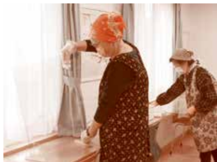
◀なごみ食堂準備の様子

生活支援体制整備事業 「ちよこつとサポート」 スタートしました 在宅の高齢者を対象に、ちよこつとした日常生活の困りごとを「できる人が、できる時に、できる範囲で」お手伝いするしくみです。 会員登録制(登録料無料) ～活動内容～ ・活動時間：午前9時～午後5時 ・1時間以内に完結するもの ・高木の剪定などの高所作業や車の運転を伴う活動はできません。 ・費用：30分につき250円 ・事前にチケットを購入 ～活動例～ ・清掃・洗濯・ゴミの搬出・部屋の模様替え・布団干し・話し相手など ・その他、些細な困りごとともご相談ください。 協力会員も随時募集しています！