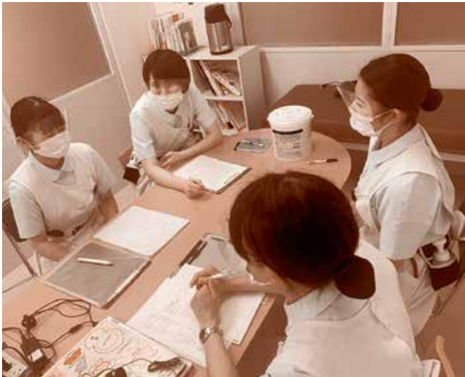
↑学生カンファレンスの様子