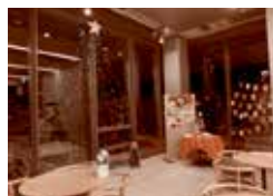
町民ホールの広尾町コーナー