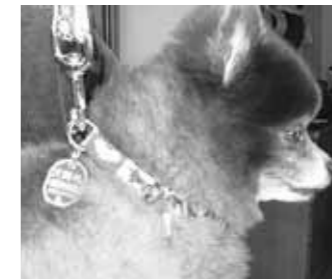
鑑札は首輪につけましょう