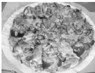
焼きあがったピザは6～8つに切り分けて熱々をどうぞ