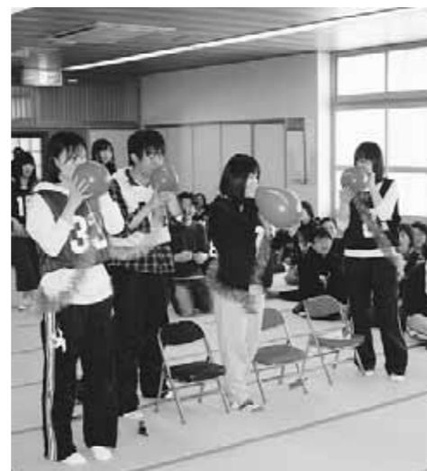
高校生ボランティアが活躍した室内ゲーム(昨年の様子)