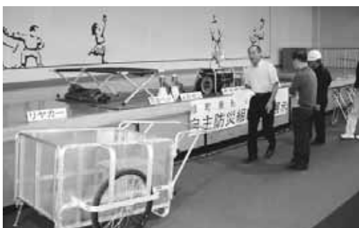
自主防災組織の装備品