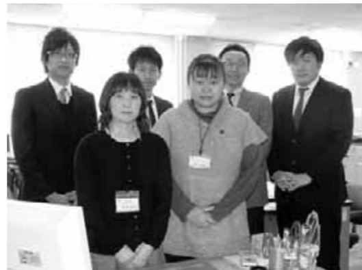
わからないことは、お気軽に声をかけてください

☎住民生活課国保医療係(役場第1庁舎1階) ☎62-9723 ✉h-kokuho@memuro.net