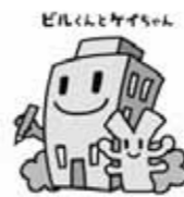
経済センサス キャラクター