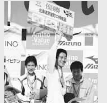
芽室町賞を手に声援に応える優勝者

11月13日(日)、第24回いびがわマラソンが、全国からおよそ10,000人のランナーを迎え開催されました。