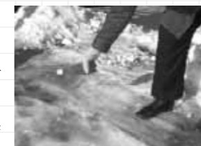
焼き砂を歩道や交差点などにまいて滑り止めに

説明にあった焼き砂は、歩道などの滑り止めに使うものと思いますが、町内会の高齢者宅の玄関先に使うのは可能でしょうか。