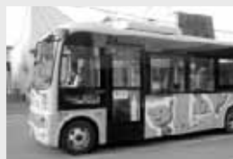
氷灯夜会場と芽室駅をじゃがバスが往復