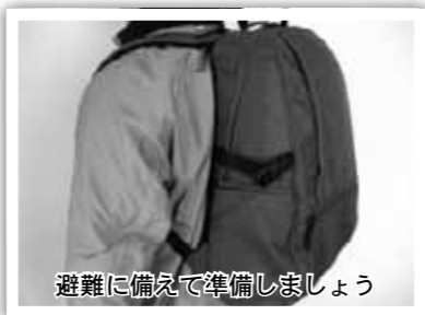
避難に備えて準備しましょう