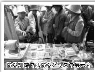
防災訓練では防災グッズの展示も