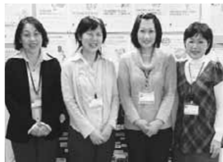
左から高道相談員、小寺相談員、織田相談員、野崎相談員

駅前プラザめむろ一ど3階に事務所をかまえる芽室消費者協会内で、消費生活相談員の皆さんは活動しています。相談員4人が交代で、月曜から金曜の10時から16時まで相談を受けています。相談件数は年に200件にもものほります。