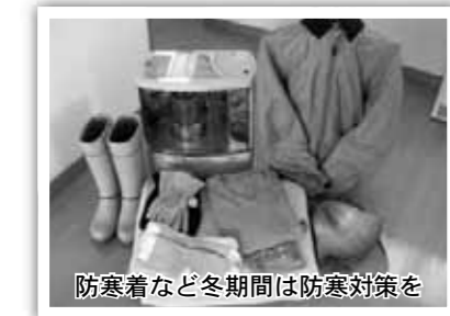
防寒着など冬期間は防寒対策を