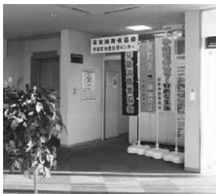
めむろ一どの西側階段を3階に上がると、すぐ横に事務所があります