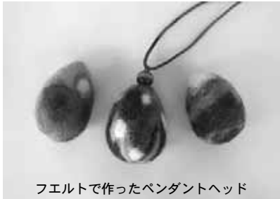
フェルトで作ったペンダントヘッド

高齢者を対象に地域のサロン活動(交流会)を行っている方や今後の活動に興味をお持ちの方などの参加をお待ちしています。