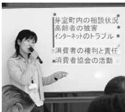
団体には出前講座もします