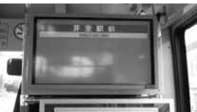
運転席後方モニター