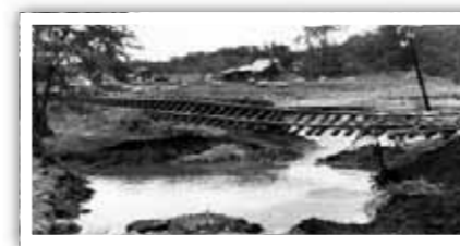
渋山川のはんらんで不通となった鉄道

いくら町が参加を呼びかけても、参加者が増えるわけではないと思います。町内会や隣近所の声掛けが重要になってくると思います。