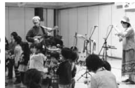
オマチマンのクリスマスコンサート 100人ほどの親子でにぎわいました