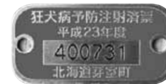
狂犬病予防注射済票