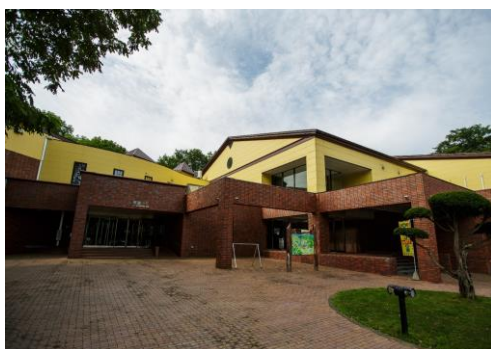
国民宿舎新嵐山荘