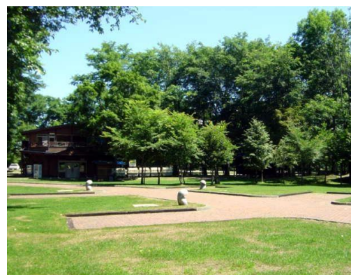
オートキャンプ場（閉鎖中）