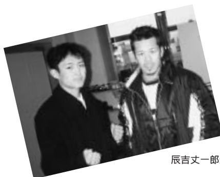
辰吉丈一郎選手と

プ ロ選手の数では、日本で一・二位を争うスポーツ『ボクシング』。そのライトフライ級に、芽室町出身のボクサーが誕生した。