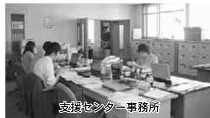
支援センター事務所

■介護予防ケアプラン作成およびサービス利用についての連絡調整、地域課題の解決の仕組み作りを行う市町村地域包括ケア推進事業を実施します。