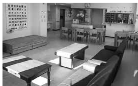
グループホームの談話室と食堂

町内東3条1丁目に「めむろ高齢者介護複合施設」が完成し、落成式が行われ開所しました。こちらの施設は、JAめむろが建物を建設し所有しています。管理運営は、1階部分を芽室町が、2・3階部分は医療法人(社)三草会(りらく)が行います。1階では介護予防事業としていきいきリハビリ教室、からだイキキ運動塾、かがやきサロンひまわりなどの業務を町がりにくく委託して実施し、2・3階はりらくがグループホーム事業を実施します。グループホームは、各階9人ずつ計18人の方の入居ができます。☎保健福祉課在宅支援係 ☎62-9724