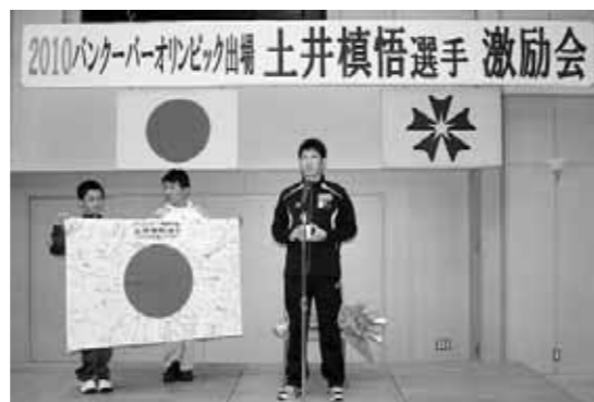
応援の寄せ書きを、スケート少年団の子どもたちがプレゼント