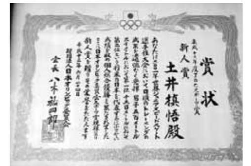
2001年世界ジュニア選手権で個人総合優勝を果たし、JOCスポーツ賞新人賞を受賞

芽室町出身(芽室町在住) 昭和58年8月23日生 26歳 A型 おとめ座 趣味 ドライブ