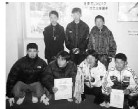
芽室西中学校で、学校対抗の十勝大会で優勝(前列左)