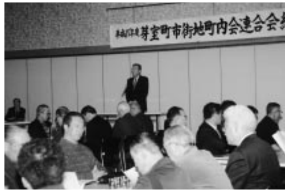
平成15年度総会の様子

なお、新役員との顔触れは下表のとおりで、任期は平成15年12月31日までとなります。