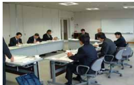
道外事務調査の様子

市町村合併に対する取り組み経過 住民投票実施の有無と情報提供等 議会としての取り組み まちづくりの施策（行財政改革等） 自治権に対する考え、住民意識の変化 国・県の動向への対応、近隣市町村の動向